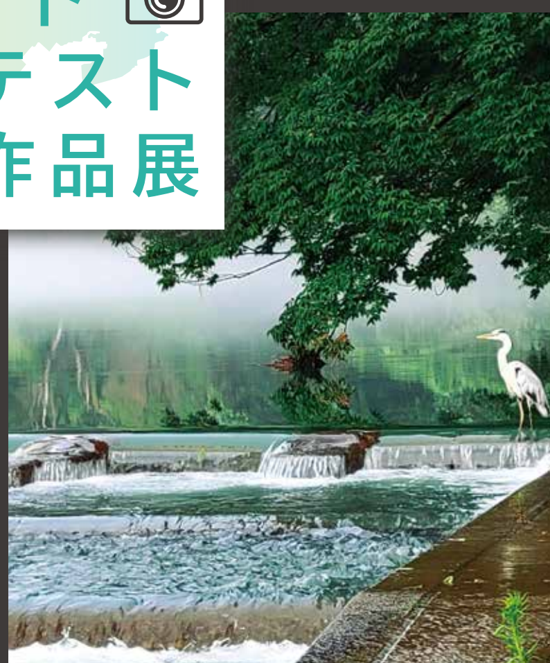
上: 第7回 めつけたさかど！デジタルフォトコンテスト 観光編 いきいき坂戸部門 最優秀賞 《コロナ禍 神楽(春)》 下: 観光編 自然・風景部門 最優秀賞 《雨上がりの八幡橋》