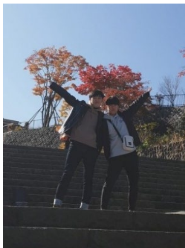
群馬県 伊香保 文化研修

皆さん機会があれば自分が住んでいたところから離れて、他のところで生活しながら良い授業を受けられるところに行くことをお勧めします。