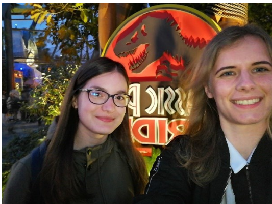
< USJ のジュラシックパークのエリア >