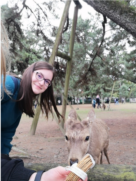
< 奈良 >