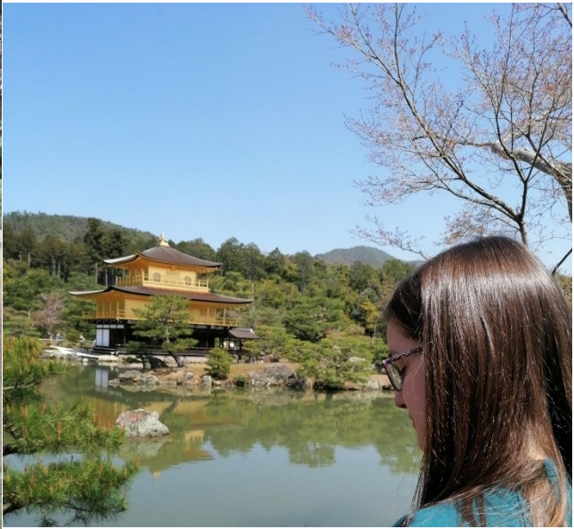
< 金閣寺 >

次に世界遺産の姫路城とナルトパークで任務を果たして、一楽ラーメンで晩ご飯を食べて、ナルトファンとして印象的場所でした。一日 USJ で過ごして（ザ・フライング・ダイナソーはおすすめです！）、京都で金閣寺や伏見稲荷などを眺めました。好きな場所はナルトパークや大阪城やユニバーサルスタジオジャパンや金閣寺でした。