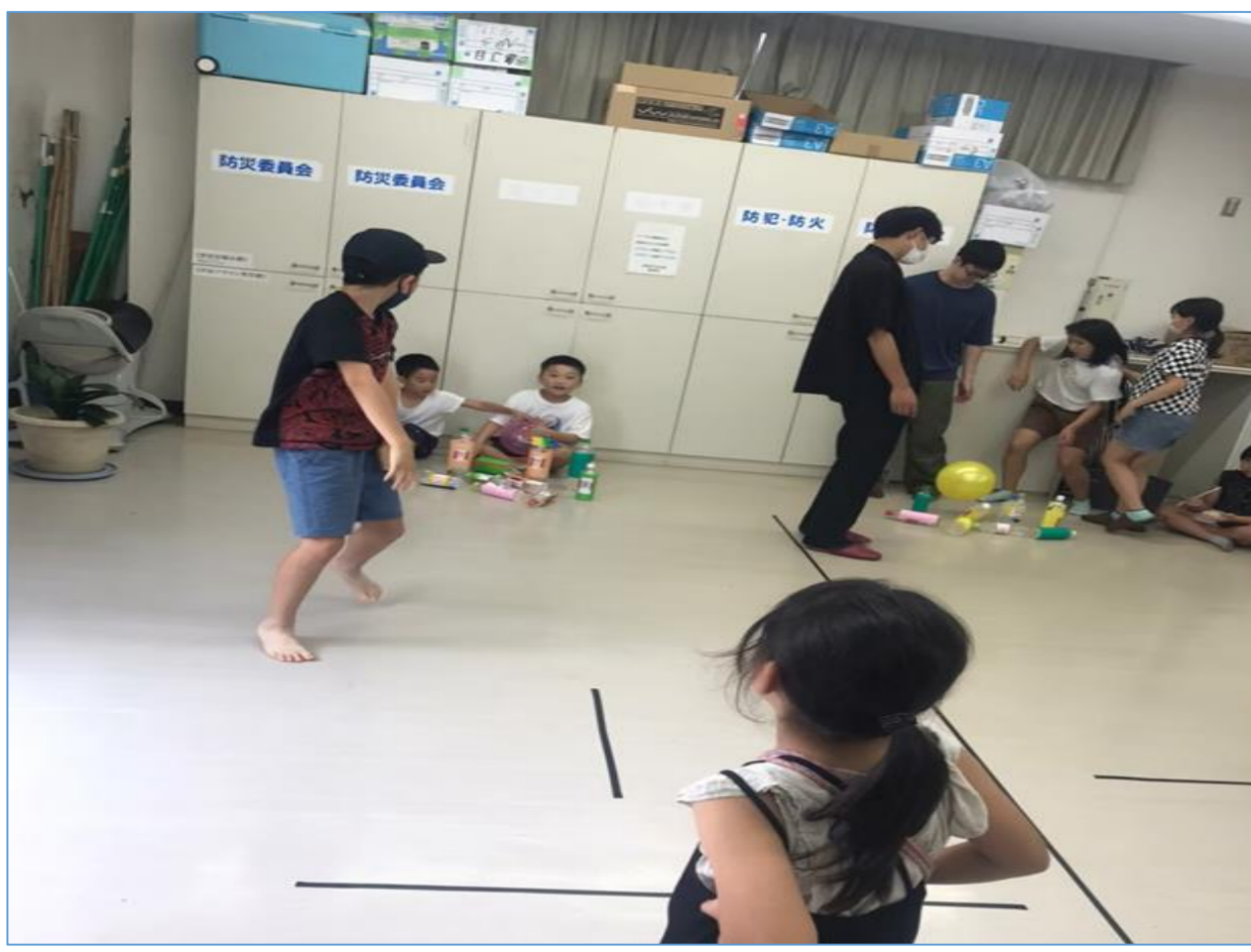
【2023年6月】 ペットボトルボウリング