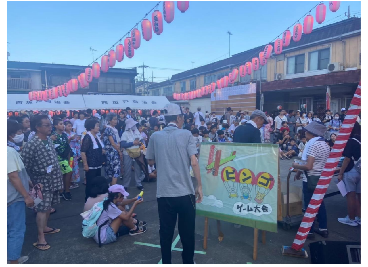
【2023年8月】 第50回西坂戸納涼祭