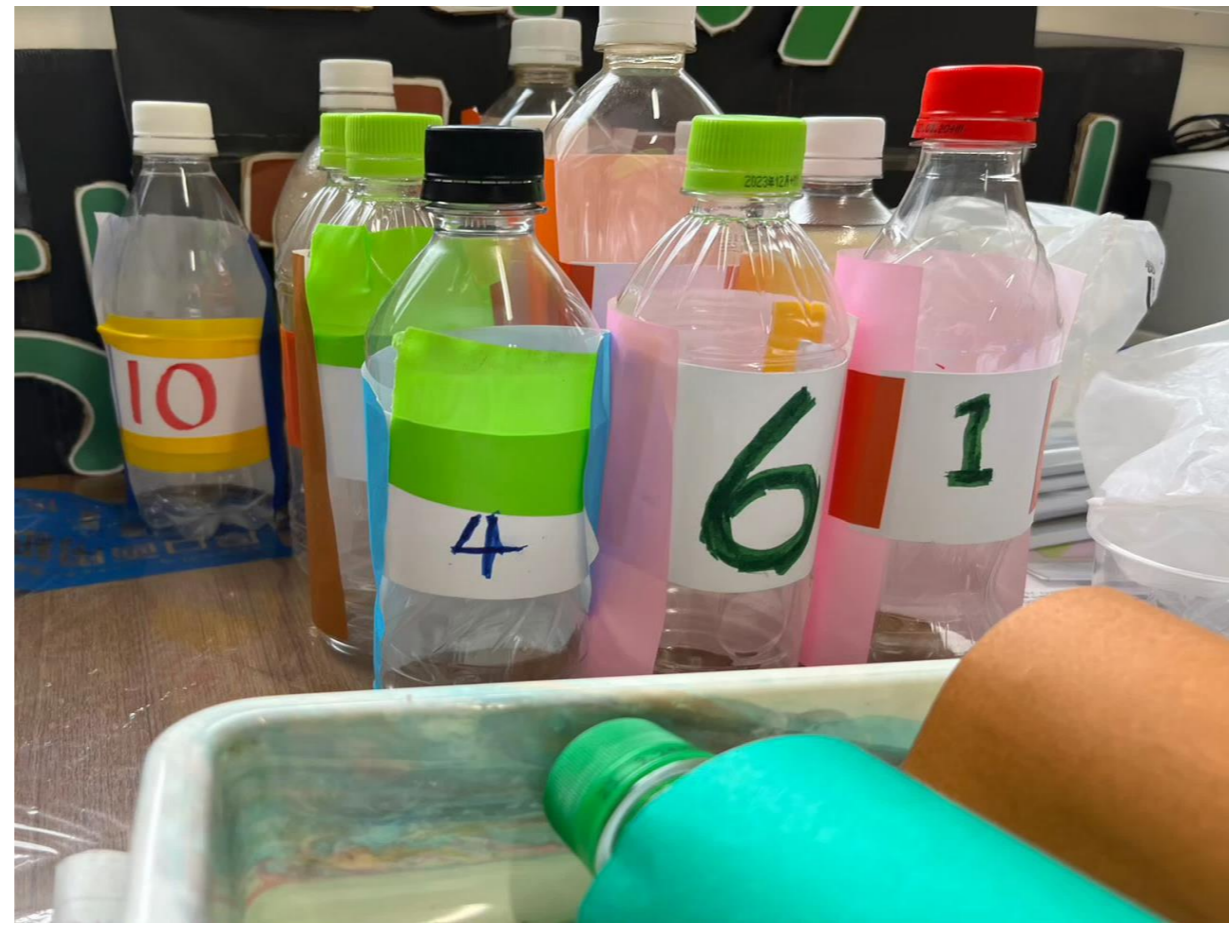
【2023年6月】 ペットボトルボウリングむけて 作製したピン